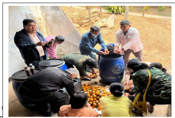
พนทททททท

การทำปุ๋ยหมักสูตรพระราชทาน ผลิตจากวัสดุเหลือใช้ที่หาได้ตามท้องถิ่นในพื้นที่ เช่น ฟางข้าว กากถั่วเหลือง เปลือกข้าวโพด เป็นต้น จากนั้นนำมาหมักร่วมกับปุ๋ยคอกและสารเร่งซุเปอร์ พด.๑ โดยมีการสนับสนุนเชื้อจุลินทรีย์สารเร่งซุเปอร์ พด. ๑ แนะนำวิธีการผลิตและวิธีการใช้ให้ถูกต้องตามหลักวิชาการ เผยแพร่สู่เกษตรกรใกล้เคียงเพื่อนำไปใช้ในพื้นที่แปลงเกษตรกรเพื่อลดต้นทุนและเพิ่มผลผลิต