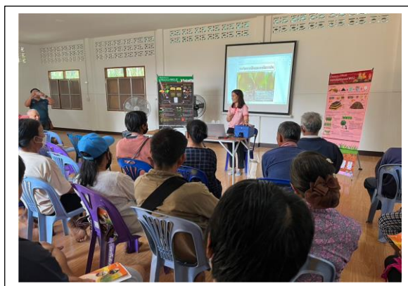
พบหน้าเนงานงนทงทงทง พนทททททท

การทำน้ำหมักชีวภาพและน้ำหมักสมุนไพรป้องกันแมลงศัตรูพืช ที่ทำจากวัสดุเหลือใช้ เศษผัก ผลไม้ และพืชสมุนไพร สนับสนุนเชื้อจุลินทรีย์สารเร่งซุเปอร์ พด. ๒ สารเร่งซุเปอร์ พด. ๗ กากน้ำตาล ถังหมัก และวัสดุหมักที่หาได้ตามท้องถิ่น แนะนำวิธีการผลิตวิธีการใช้ให้ถูกต้องตามหลักวิชาการ เผยแพร่สู่เกษตรกรนำไปใช้ในพื้นที่